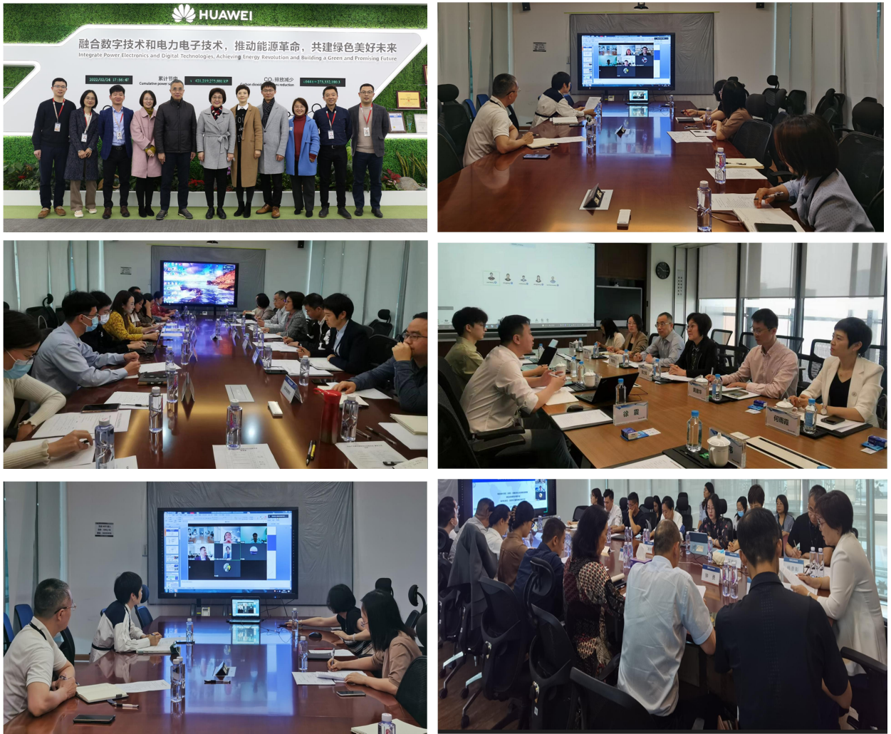
图 1 部分调研交流照片